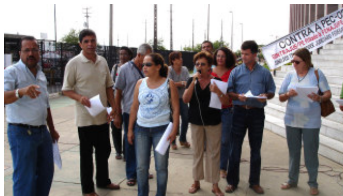
FÓRUM Entidades realizaram ato unificado no Fórum do Recife

devem entregar a seguinte documentação, sempre em cópia autenticada: RG, CPF, carteira profissional (folhas com foto, qualificação civil, contrato de trabalho e opção de FGTS), rescisão contratual (se houver), extrato analítico do FGTS e PIS. Em seguida, é necessário assinar e reconhecer firma da assinatura na procuração disponível no sindicato.