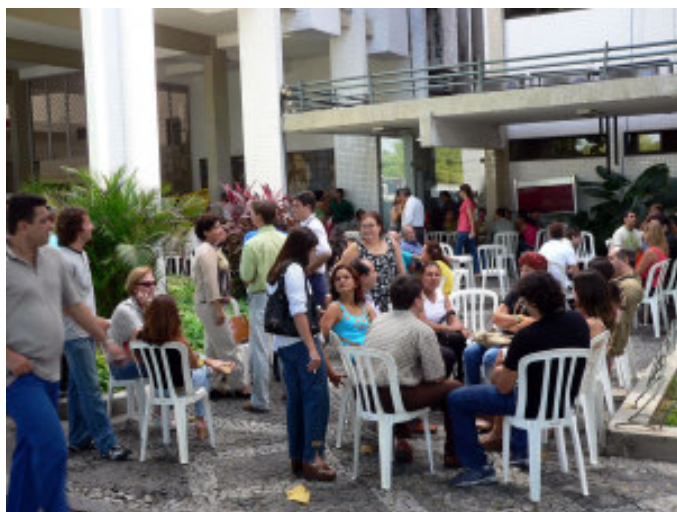
PARALISAÇÃO Cerca de 200 servidores participaram da greve no TRT