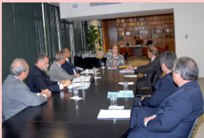
REUNIÃO ADMINISTRATIVA Ministros do STF aprovam anteprojeto

O anteprojeto que altera dispositivos da lei 11.416/2006, da revisão do Plano de Cargos e Salários dos trabalhadores do Judiciário Federal, foi aprovado pelo Pleno do Supremo Tribunal Federal (STF) em reunião administrativa no dia 5 de fevereiro e encaminhado pelo STF ao Congresso Nacional em 7 de março. Algumas das mudanças fazem parte de uma proposta enviada pela Fenajufe no final de janeiro. O documento também foi assinado pelos presidentes dos outros tribunais superiores.