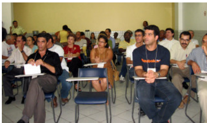
ASSEMBLÉIA Servidores elegem delegados para o Congrejufe

O VI Congresso Nacional da Fenajufe (Congrejufe) será realizado de 28 de março a 1º de abril, em Gramado (RS), para definir as diretrizes gerais que a nortearão as atividades da federação e eleger a sua nova direção. A pauta do encontro inclui conjuntura nacional e internacional; plano de carreira; balanço da atuação da Fenajufe e prestação de contas do período de maio de 2006 a fevereiro de 2007; alterações estatutárias e regimento eleitoral; plano de lutas; eleição da Diretoria Executiva e do Conselho Fiscal; e moções.